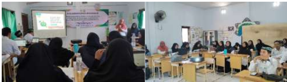
Gambar 1. Pelatihan pembuatan media pembelajaran berbasis AI

Pelatihan terbagi menjadi dua sesi utama: Pertama, Pembuatan video pembelajaran berbasis AI: melibatkan penggunaan ChatGPT (untuk penulisan naskah), Leonardo. ai (untuk gambar), Haiper. ai (untuk animasi), TTSMaker (untuk suara), dan perangkat lunak pengedit video. Kedua, Pembuatan buku digital interaktif: menggunakan ChatGPT, Book Creator, Quizizz, dan Padlet. Suasana pelatihan seperti yang ditunjukkan pada Gambar 1.