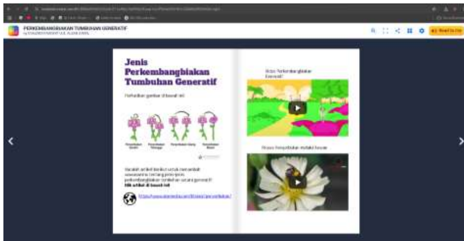
Gambar 6. Buku Digital Interaktif Perkembangbiakan Taumbuhan