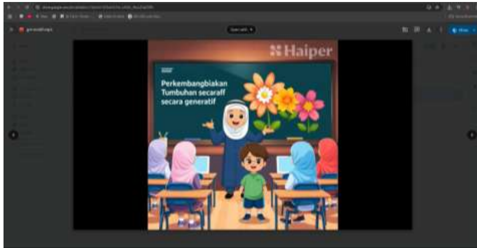
Gambar 5. Video interaktif Perkembangbiakan Taumbuhan

interaktif seperti gambar, audio, dan tautan soal. Produk-produk ini menunjukkan kreativitas dan penerapan nyata dari pelatihan yang telah diberikan.