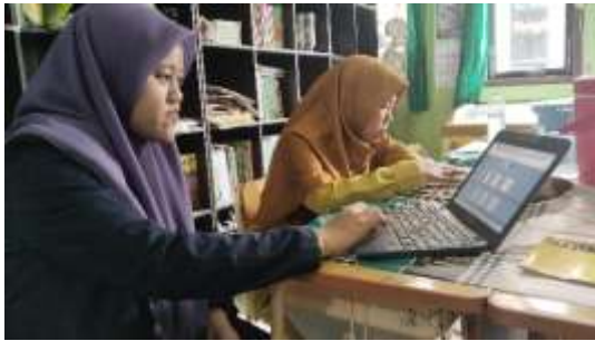
Gambar 2. Pendampingan setelah pelatihan

Pendampingan intensif disediakan oleh tim peneliti dan mahasiswa untuk memastikan guru mampu menerapkan keterampilan yang telah didapatkan. Para guru diberi tugas untuk menghasilkan satu produk video dan satu buku digital sesuai dengan kurikulum yang diajarkan. Proyek ini dilakukan secara individu maupun kelompok, dengan bimbingan dari tim peneliti, seperti yang terlihat pada Gambar 2.